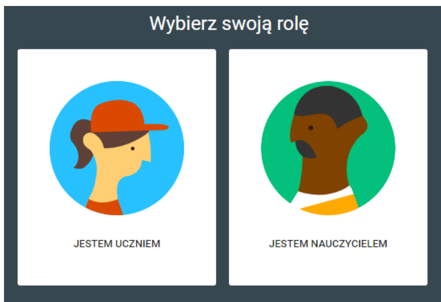
Rysunek 3 (Wybór roli)

W następnym kroku pojawi się okno wyboru roli – Uczeń lub Nauczyciel.